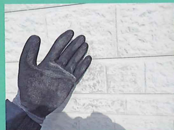
手に白い粉が付く